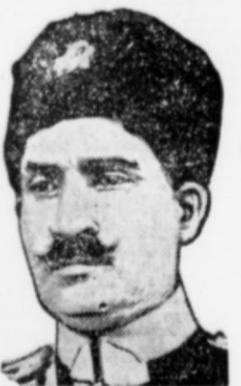
Persiens Hersker Riza Khan.

Trods Massakrerne tæl'er Kurderne endnu et Par Hundrede Tusinde Mennesker, og de har under Tilbagetog for Tyrkerne samlet sig paa persisk Omraade, hvor der anvendes lempeligere Midler imod dem. Perserne har